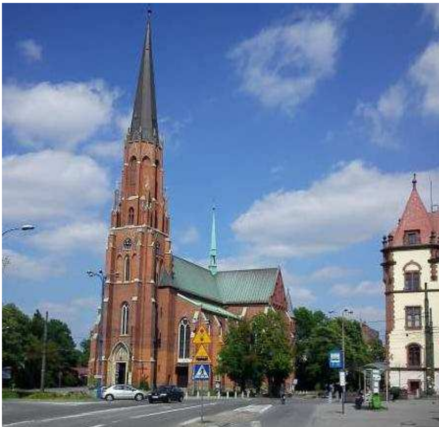
Plebania kościoła parafialnego p. w. Najświętszego Serca Pana Jezusa ul. Starokościelna 3