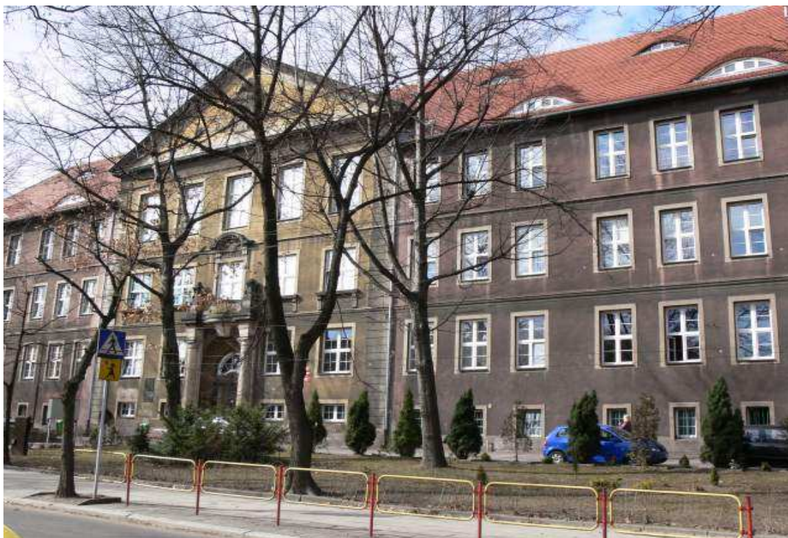
Gmach Liceum Handlowego Plac Wolności 5