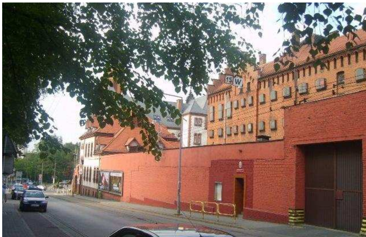
Zespół Szpitala Miejskiego Nr 1 ul. Mikołowska 1