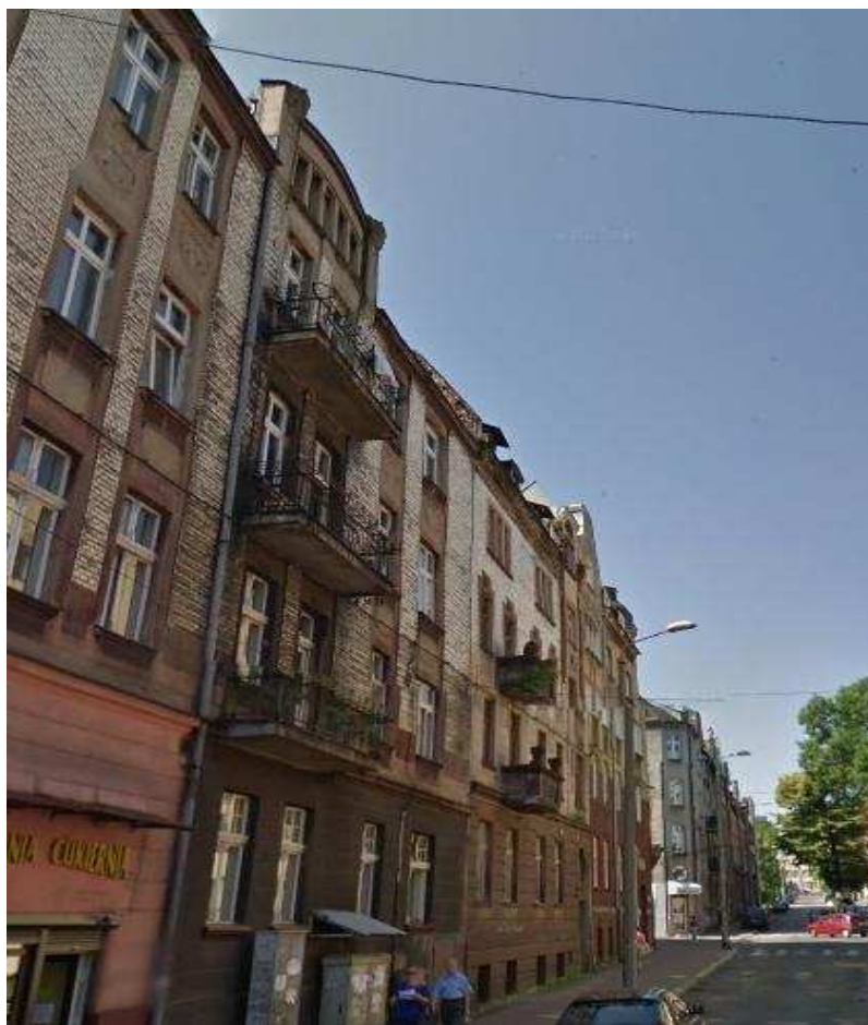
Zespół budynków Szkoły Sportowej u zbiegu ulic Boliny i Gwarków