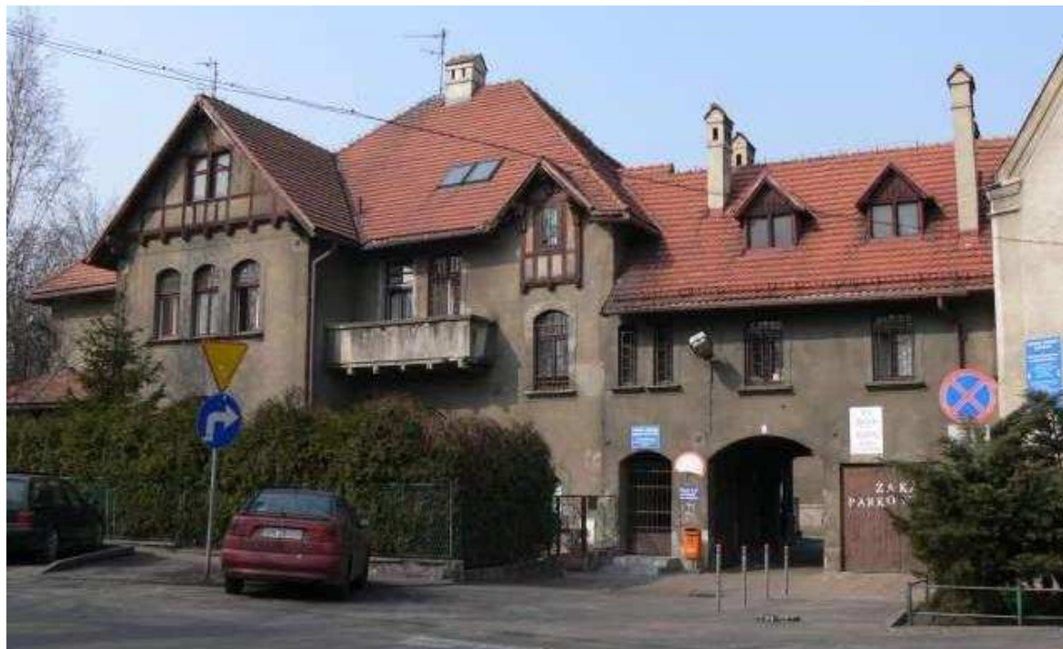
Gmach II Liceum Ogólnokształcącego ul. Mikołowska 3 – 5