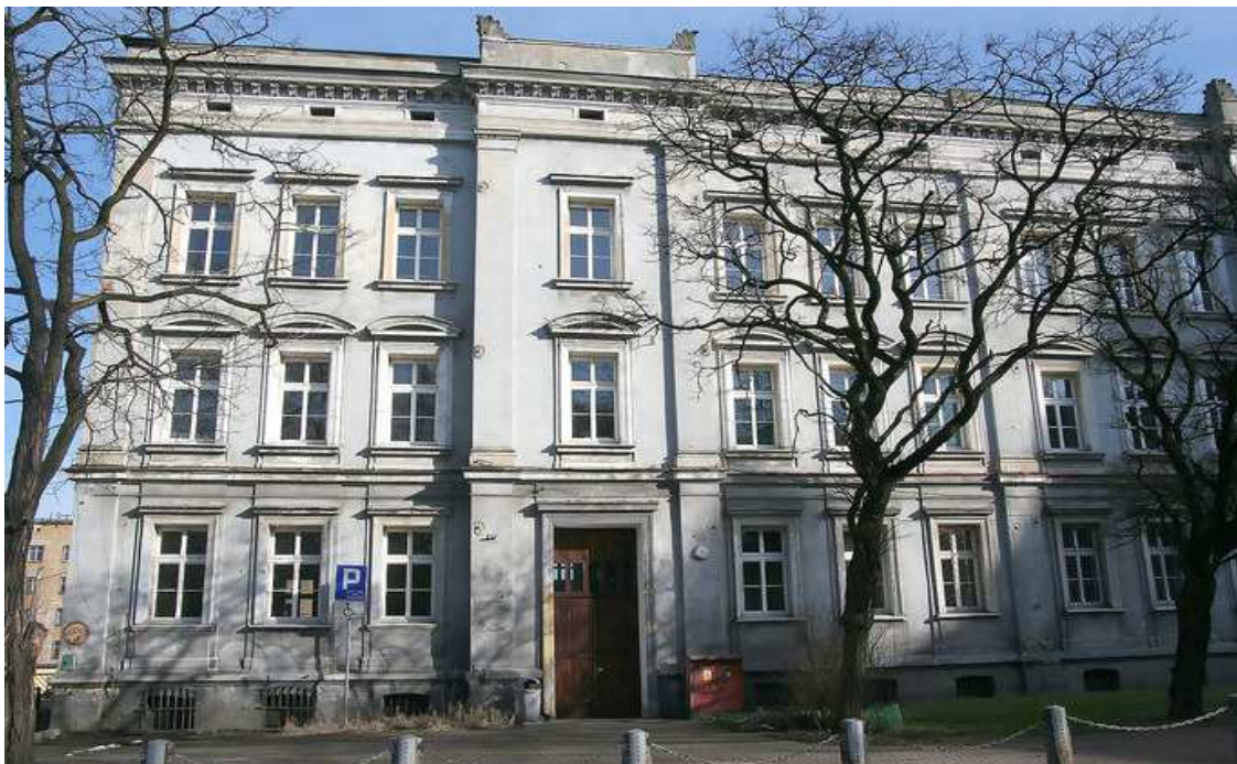
Kamienica w stylu eklektycznym ul. Grunwaldzka 20