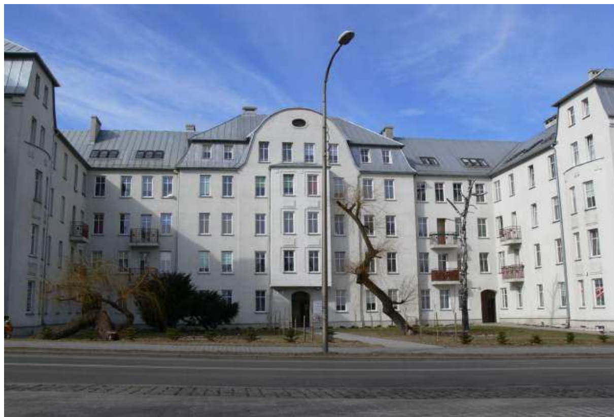
Budynek w stylu historyzmy ul. Kacza 2