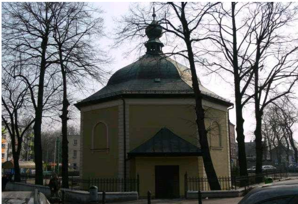
Kościół filialny p. w. Narodzenia Najświętszej Marii Panny ul. Starokościelna 5