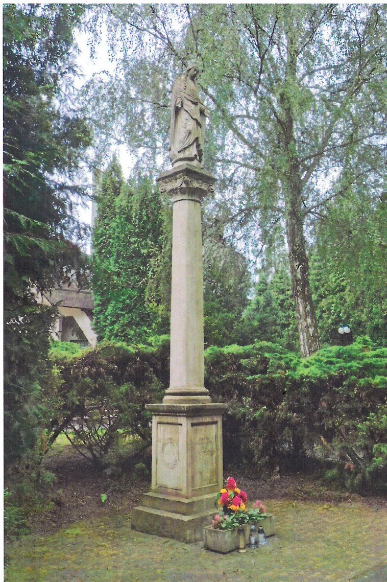
Widok od północnego-zachodu

7. Fotografia z opisem wskazującym orientację w stosunku do sąsiednich terenów lub stron świata albo mapa z zaznaczonym stanowiskiem archeologicznym