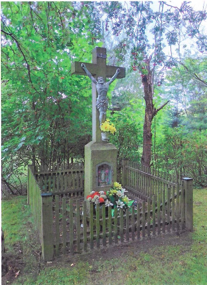
Widok od północnego-zachodu

7. Fotografia z opisem wskazującym orientację w stosunku do sąsiednich terenów lub stron świata albo mapa z zaznaczonym stanowiskiem archeologicznym