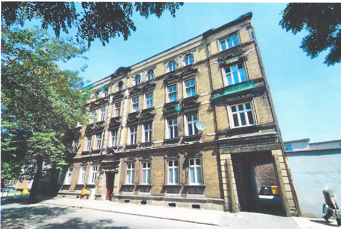
Widok budynku od południowego-zachodu

7. Fotografia z opisem wskazującym orientację w stosunku do sąsiednich terenów lub stron świata albo mapa z zaznaczonym stanowiskiem archeologicznym