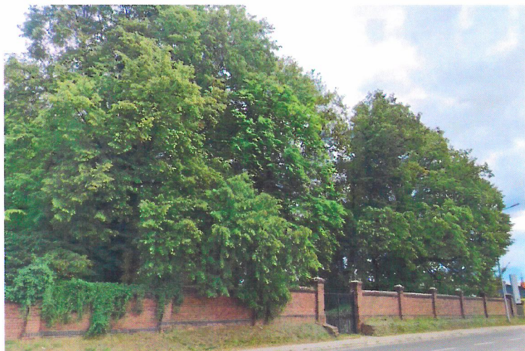
Widok od północnego-zachodu

7. Fotografia z opisem wskazującym orientację w stosunku do sąsiednich terenów lub stron świata albo mapa z zaznaczonym stanowiskiem archeologicznym