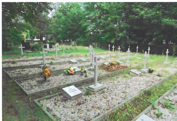
Widok od południowego-wschodu