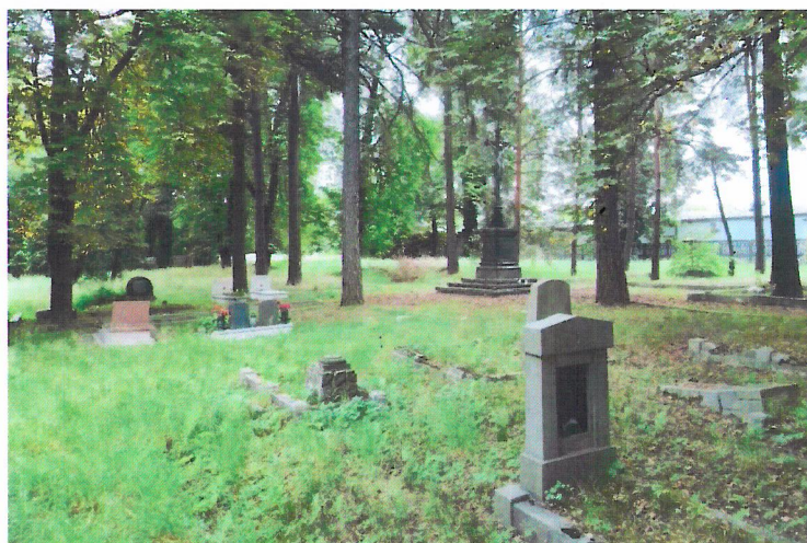
Widok od północnego-zachodu