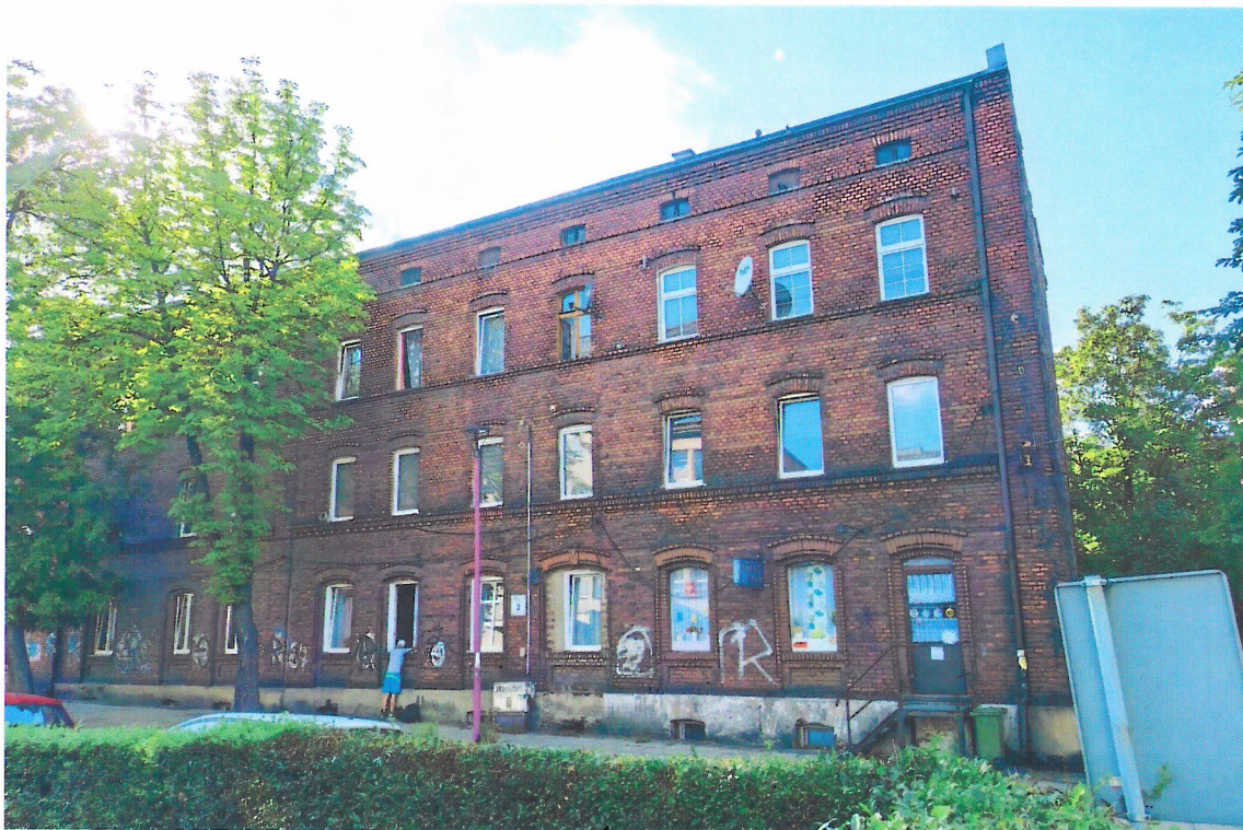
Widok budynku od południowego-wschodu

7. Fotografia z opisem wskazującym orientację w stosunku do sąsiednich terenów lub stron świata albo mapa z zaznaczonym stanowiskiem archeologicznym