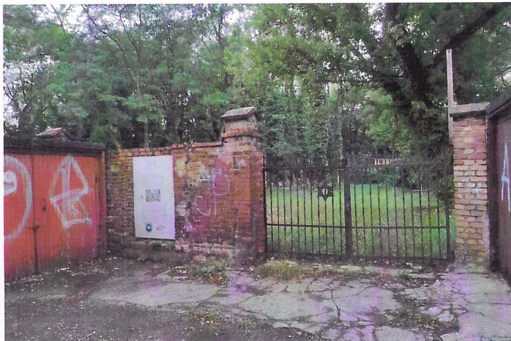
Widok od północnego-wschodu

7. Fotografia z opisem wskazującym orientację w stosunku do sąsiednich terenów lub stron świata albo mapa z zaznaczonym stanowiskiem archeologicznym