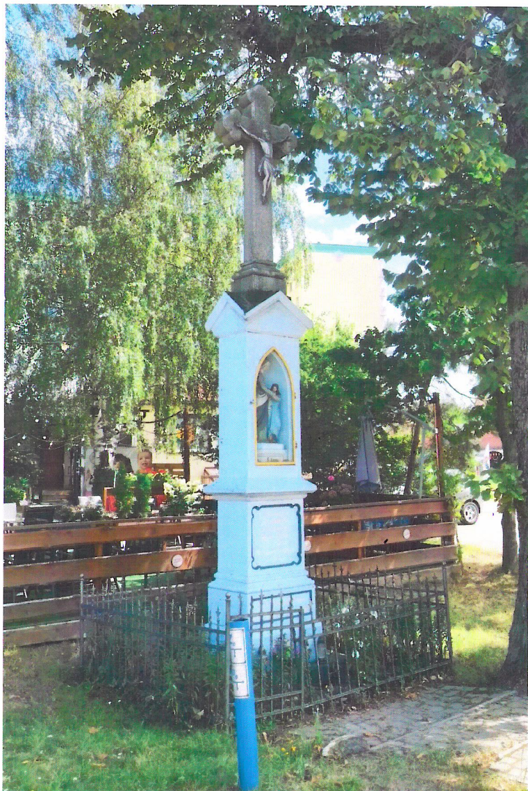
Widok od północnego-zachodu

7. Fotografia z opisem wskazującym orientację w stosunku do sąsiednich terenów lub stron świata albo mapa z zaznaczonym stanowiskiem archeologicznym