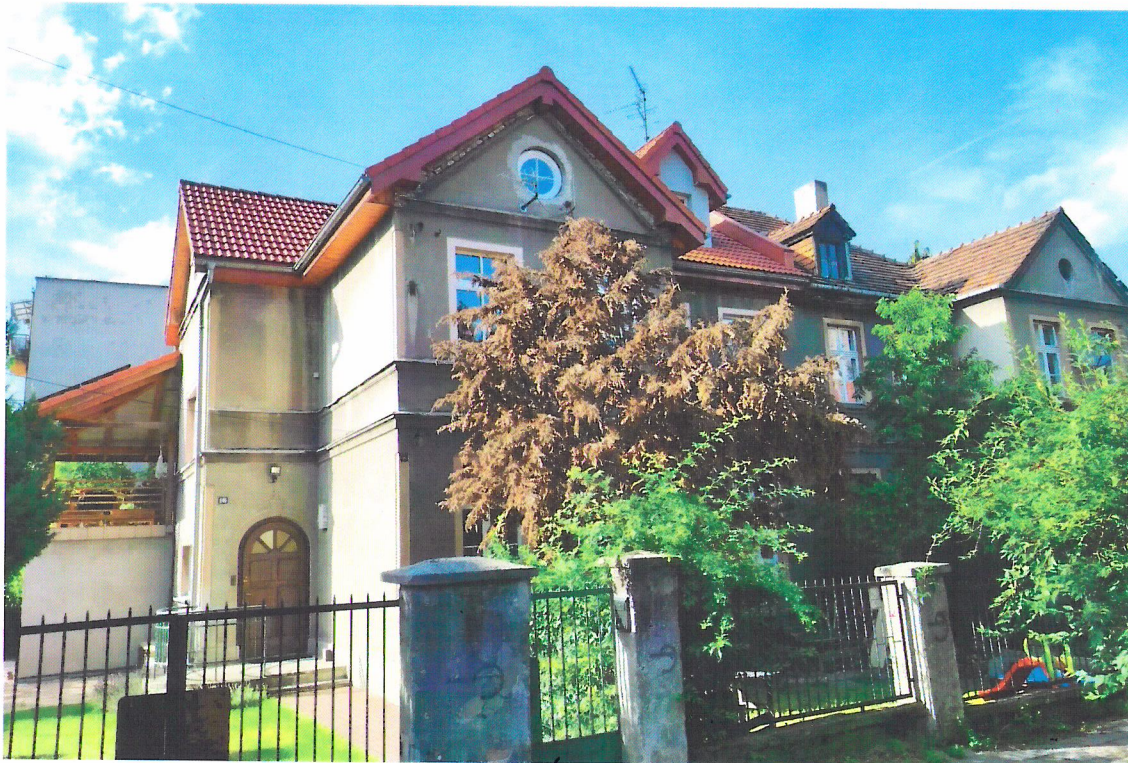
Widok budynku od południa

7. Fotografia z opisem wskazującym orientację w stosunku do sąsiednich terenów lub stron świata albo mapa z zaznaczonym stanowiskiem archeologicznym