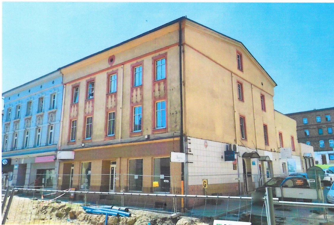
Widok budynku od północy

7. Fotografia z opisem wskazującym orientację w stosunku do sąsiednich terenów lub stron świata albo mapa z zaznaczonym stanowiskiem archeologicznym