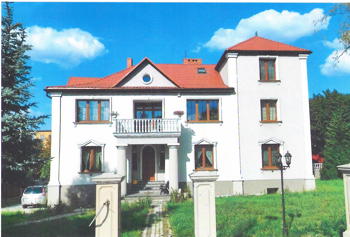
Widok budynku od południowego-zachodu

7. Fotografia z opisem wskazującym orientację w stosunku do sąsiednich terenów lub stron świata albo mapa z zaznaczonym stanowiskiem archeologicznym